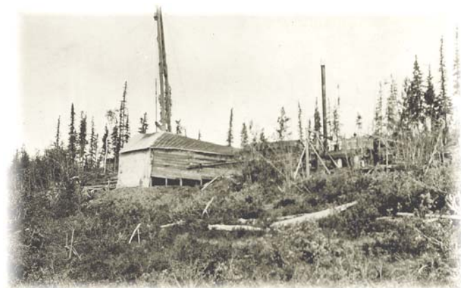
Installations de forage à Norman Wells dans les années 1920

Les Dénés vivant le long du fleuve Mackenzie savaient qu'il y avait du pétrole dans la région de Norman Wells bien avant les géologues. Ils se servaient du goudron extrait de suintements de pétrole, mélangé avec de la gomme des arbres, pour sceller leurs canots, et il est aussi possible qu'ils en aient fait le commerce avec d'autres nations. Au début des années 1900, ils ont guidé les géologues qui exploraient les environs de Fort Norman (Tulita) à Legohli – « là où il y a du pétrole ». Les premiers puits de pétrole y ont été forés en 1920, et depuis l'endroit est connu sous le vocable Norman Wells.