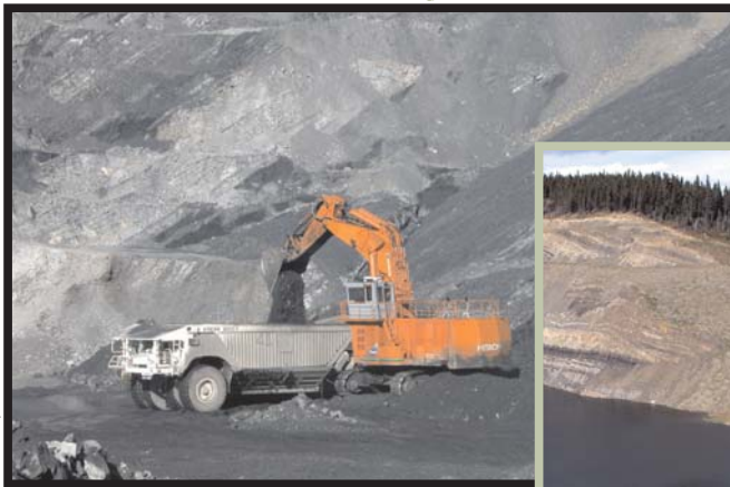
Chargement de charbon à la mine Cheviot de la Elk Valley Coal Corporation, près de Hinton, Alberta

Couches fortement plissées de charbon et de roches sédimentaires; mine Luscar de la Elk Valley Coal Corporation, près de Hinton, Alberta