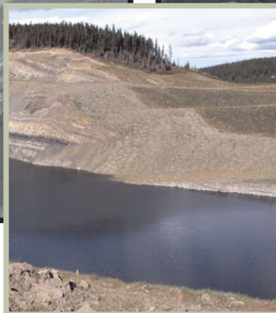
Fosse à ciel ouvert remise en état, à la mine Luscar de la Elk Valley Coal Corporation, près de Hinton, Alberta