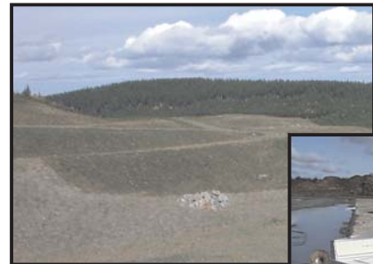
Fosse restaurée de la mine à ciel ouvert Luscar de l'Elk Valley Coal Corporation, près de Hinton, Alberta

Compte tenu de sa considérable influence sur l'économie canadienne, l'exploitation minière a à peine perturbé 3000 km 2 de terres au Canada, soit moins de 0,03 % de la superficie du pays, afin de produire des minéraux et des produits minéraux. De nos jours, les zones exploitées peuvent être presque entièrement remises dans leur état d'origine, car la population comme les sociétés minières savent maintenant mieux en quoi consiste la responsabilité environnementale. Même le recyclage des ressources constitue aujourd'hui une industrie qui, d'ailleurs, recycle des millions de tonnes de métaux et d'autres minéraux annuellement.