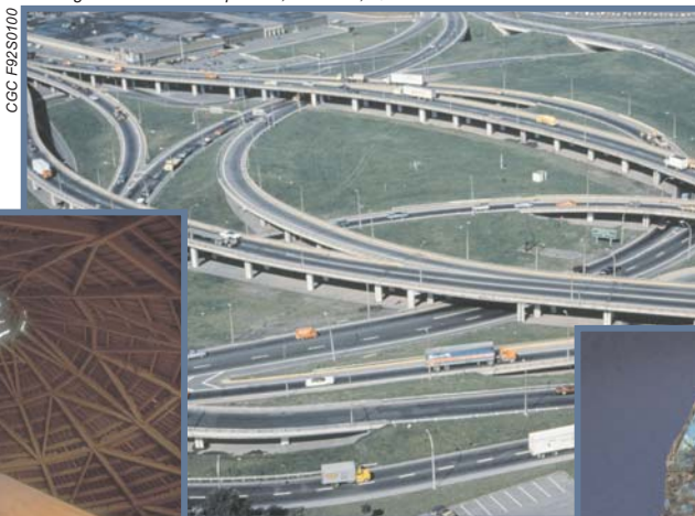
Échangeur Décarie-Métropolitain, Montréal, Québec

Les minéraux industriels sont abondants et ont de nombreuses applications. Les sels provenant d'anciennes mers servent d'engrais (potasse) et d'aromatisants (halite). La halite est beaucoup utilisée dans l'industrie des produits chimiques. Les cloisons sèches sont composées de gypse. Le revêtement de roche des immeubles est appelé « pierre de taille », laquelle comprend le calcaire, que l'on extrait notamment à ciel ouvert à Garson, au Manitoba, et la labradorite, que l'on exploite près de Nain, au Labrador. Le Canada compte plus de 3000 carrières de pierre et carrières de sable et de gravier. Le sable et le gravier (granulats) servent à aménager des routes et des chemins de fer, ainsi qu'à construire des fondations d'immeuble. L'argile, quant à elle, est utilisée pour produire des briques et des tuiles.