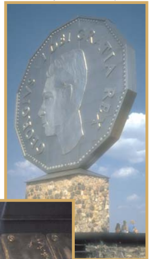
Monument « Big Nickel », Sudbury, Ontario

Certains minéraux et certaines roches peuvent chevaucher deux catégories. Par exemple, les diamants peuvent constituer des minéraux industriels, à titre d'abrasifs, ainsi que des pierres précieuses ou ornementales, tandis que l'or, qui est un métal précieux, a des applications ornementales et industrielles.