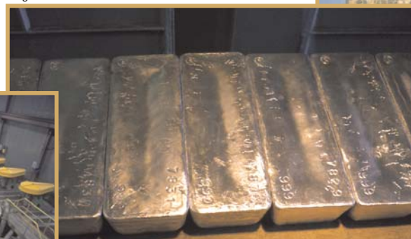
Lingots d'or dans une raffinerie d'Inco