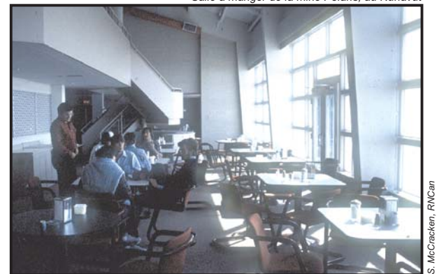
Salle à manger de la mine Polaris, au Nunavut

n'y aurait pas d'électricité, d'aliments sur nos tables et d'engrais pour cultiver des fruits et des légumes. Le Canada bénéficie de ressources minérales considérables et diversifiées; plus de 60 minéraux y sont exploités. L'industrie minière y emploie d'ailleurs beaucoup de personnes, soit plus d'un million en l'occurrence.