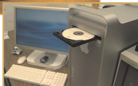
Éléments des terres rares, dans un écran, un graveur de DVD et des disques durs d'ordinateur