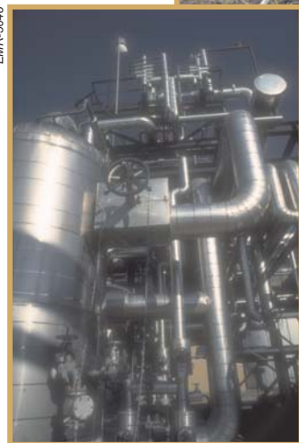
Raffinerie pétrochimique d'ESSO, Cold Lake, Alberta

Le platine est habituellement associé à la bijouterie. Toutefois, les métaux du groupe platine ont de nombreuses applications dans l'industrie pétrochimique ou automobile. Les éléments des terres rares, tels que l'yttrium et le scandium, ne sont pas particulièrement rares dans la croûte terrestre, mais ils sont rarement concentrés à un endroit. Ils ont de la valeur, car ils sont nécessaires pour fabriquer des lasers, des écrans de téléviseur et d'ordinateur, des superaimants pour disque dur, de même que des piles rechargeables, lesquelles sont moins nuisibles pour l'environnement.