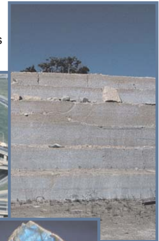
Carrière de Garson, au Manitoba