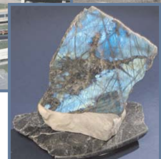
Labradorite (artiste : Jamie Meyer)