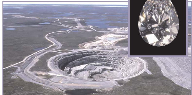
Fosse Panda de la mine de diamants Ekati, Territoires du Nord-Ouest