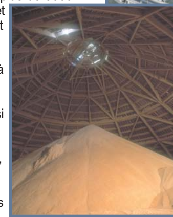
Entrepôt de potasse, Esterhazy, Saskatchewan