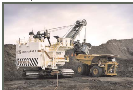
De nos jours, l'extraction se fait avec une pelle mécanique d'une capacité de 100 tonnes et des camions à benne de 400 tonnes

Dans les projets d'exploitation des sables bitumineux en cours, 70 à 90 % des eaux utilisées pour extraire le bitume sont recyclées.